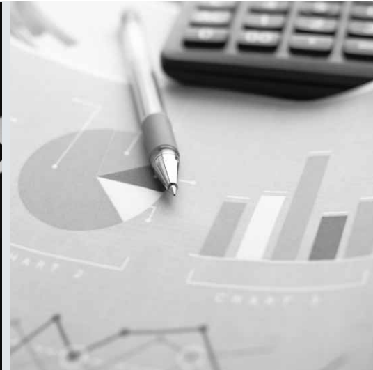
ANÁLISIS DE DATOS