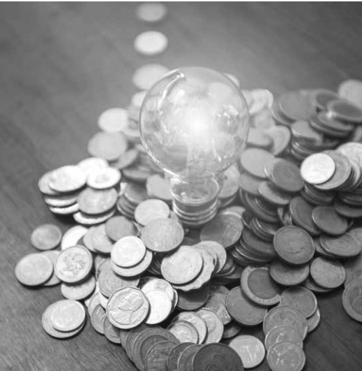
OPTIMIZACIÓN DE COSTES